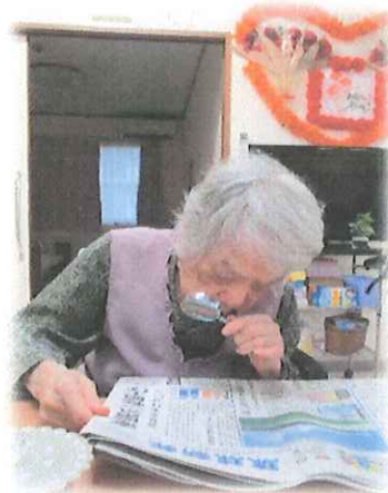
ルーペをつかって！